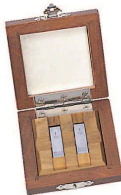
Zestaw 2 płytek węglkowych