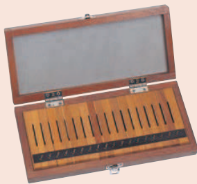
Zestaw 18 płytek stalowych